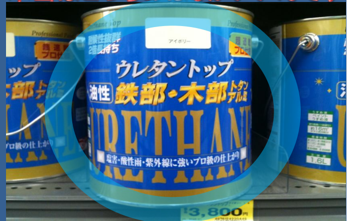
商品名(油性:ウレタントップ) 気になる値段: ¥4,000弱

水性だから臭いが少ないし、価格も安いし皆さんが買ってしまいがちな商品です。基本的には、コンクリートやサイディングの壁への塗装にむいています。鉄部に塗装できると明記してありますが、鉄部には水性塗料を塗らないのが我々専門業者の意見です。また、【成分:合成樹脂(シリコンアクリル・フッ素)・顔料・紫外線劣化防止剤・サビ止め剤・防カビ剤】と明記してありますが、我々業者は、シリコン・アクリル・フッ素・サビ止めは全て別々の商品として取り扱っており、これらの成分が混ざっていて、それぞれの機能を十分に発揮できるか？というのが疑問なのです。1年前後で塗膜が剥がれてくる可能性があるのであまりお勧めできません。